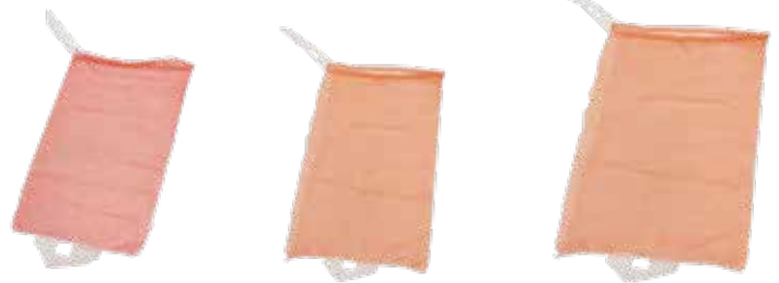
玉葱 10kg K赤 玉葱 10kg 赤 玉葱 20kg 赤