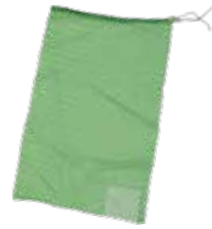
種籾消毒袋 緑 (不織布ラベル)