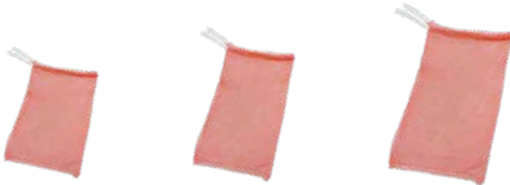
玉葱・みかん 2kg K赤