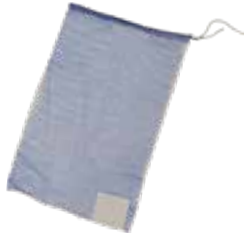
種籾消毒袋 青 (不織布ラベル)

玉葱ネットに比べ、太い糸を使っているので生地が 丈夫です。重量物 (MAX18kg) の梱包もOK!