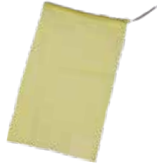
種籾消毒袋 黄 (不織布ラベル)