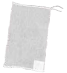
種籾消毒袋 白 (不織布ラベル)