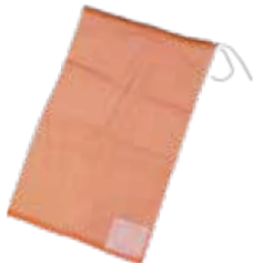
種籾消毒袋 赤 (不織布ラベル)