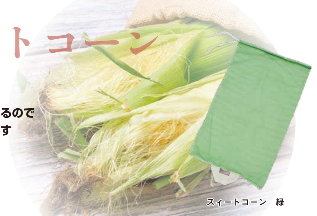
スイートコーン 緑