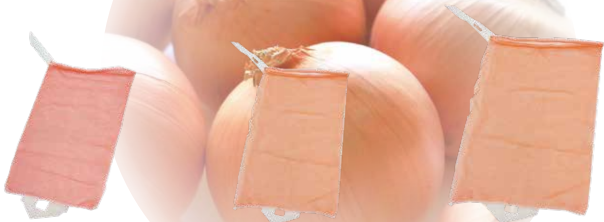
玉葱 10kg K赤