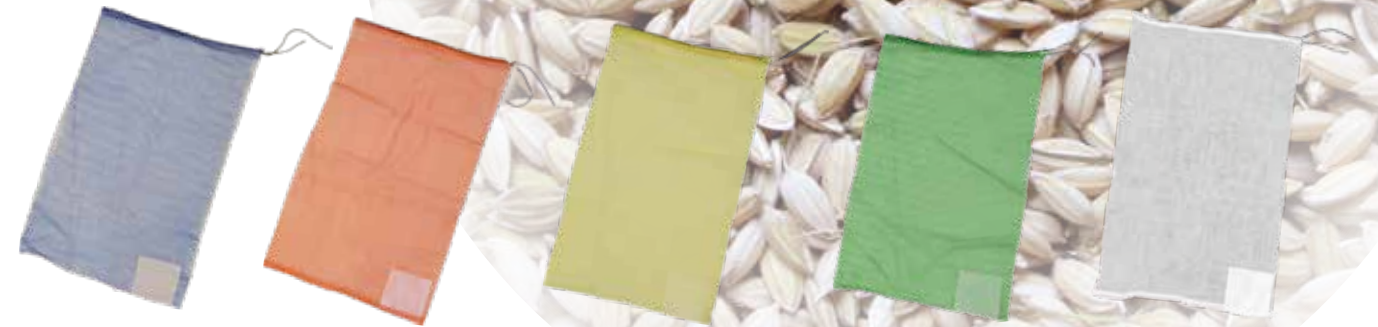
種籾消毒袋 青 (不織布ラベル)